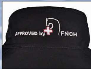
FNCH Stickerei am Kragen